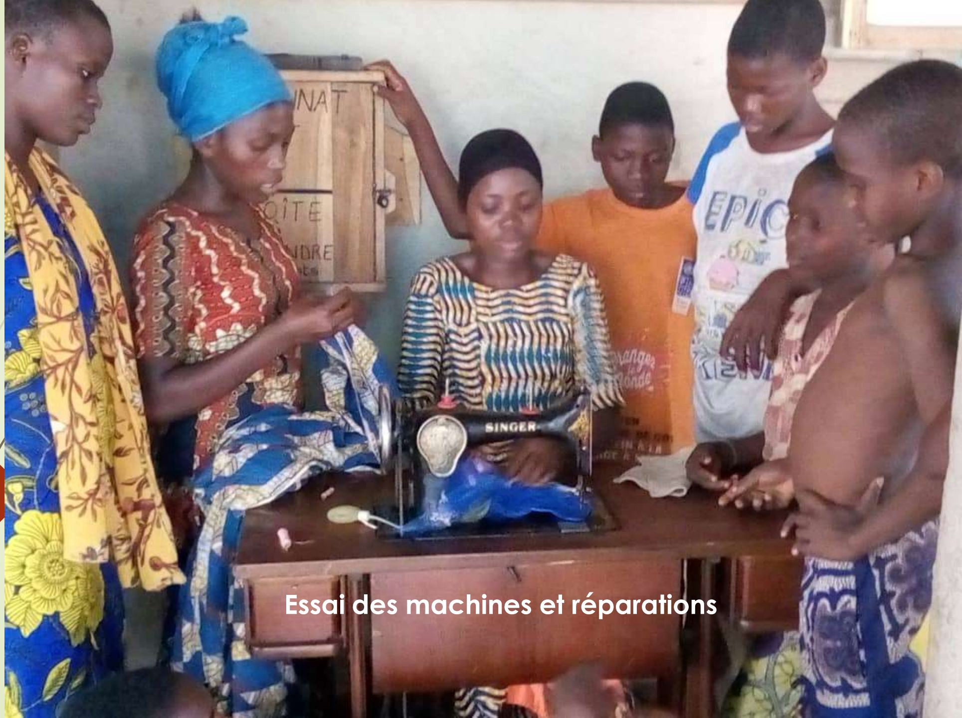
Essai des machines et réparations