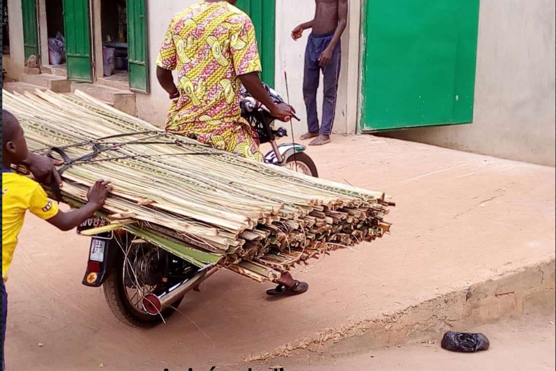
Arrivée de tiges