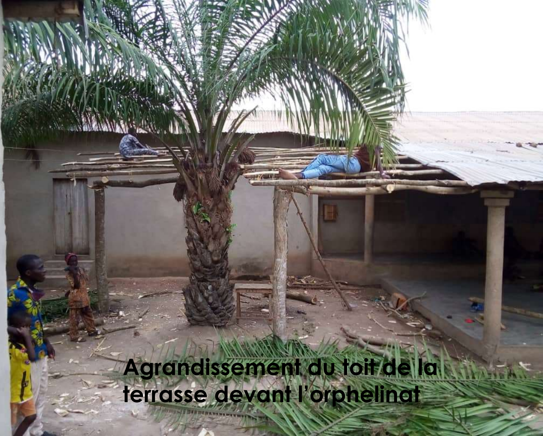
Agrandissement du toit de la terrasse devant l'orphelinat