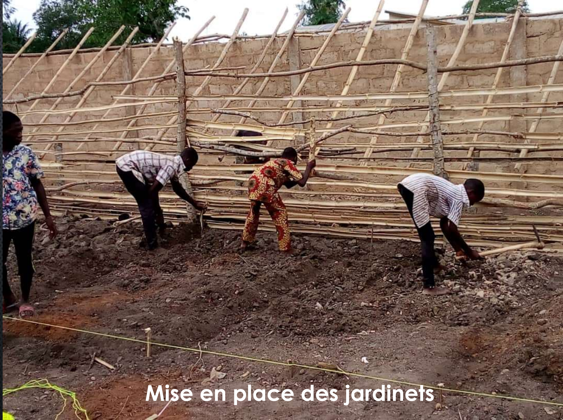
Mise en place des jardinetts