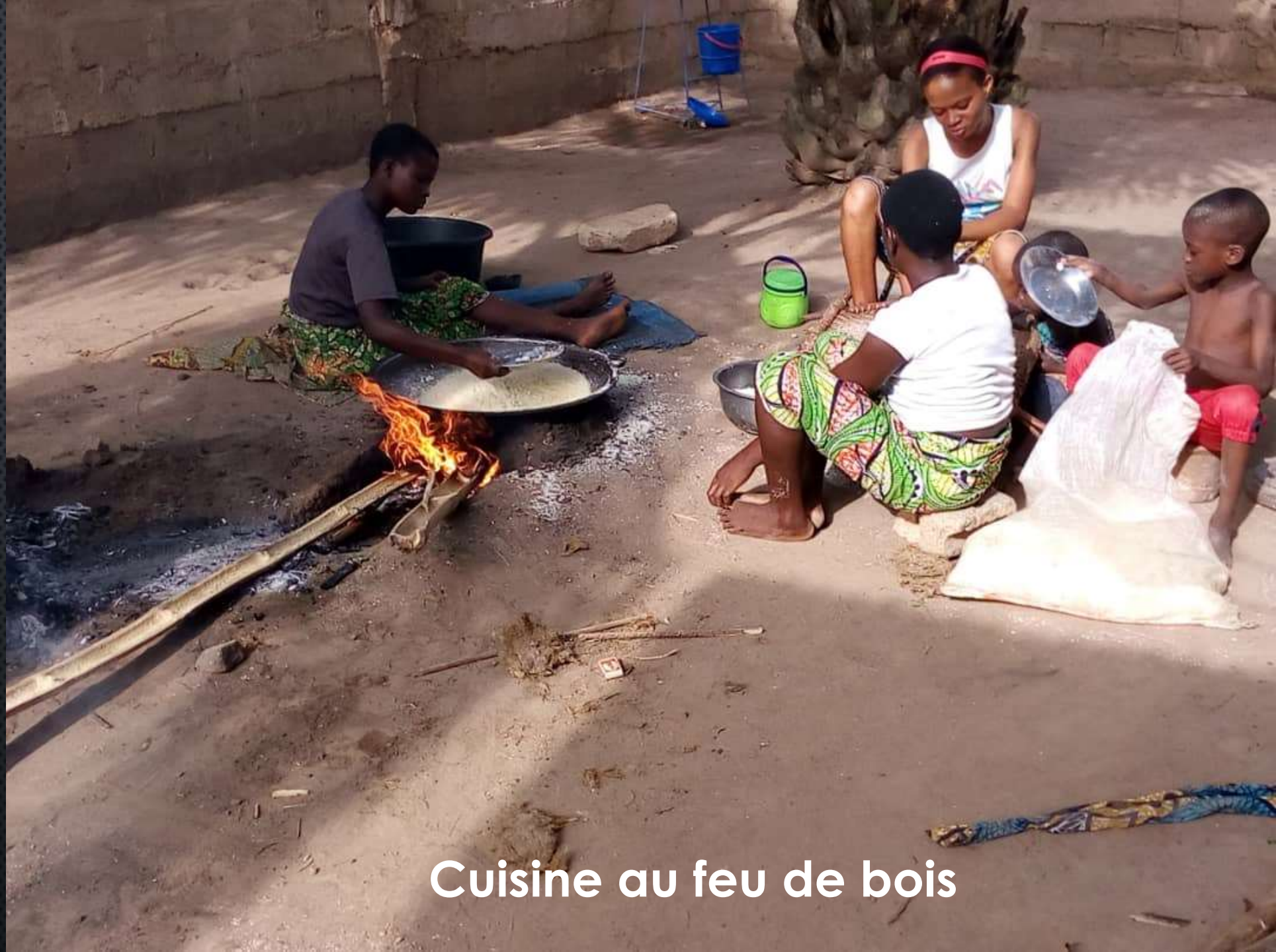
Cuisine au feu de bois