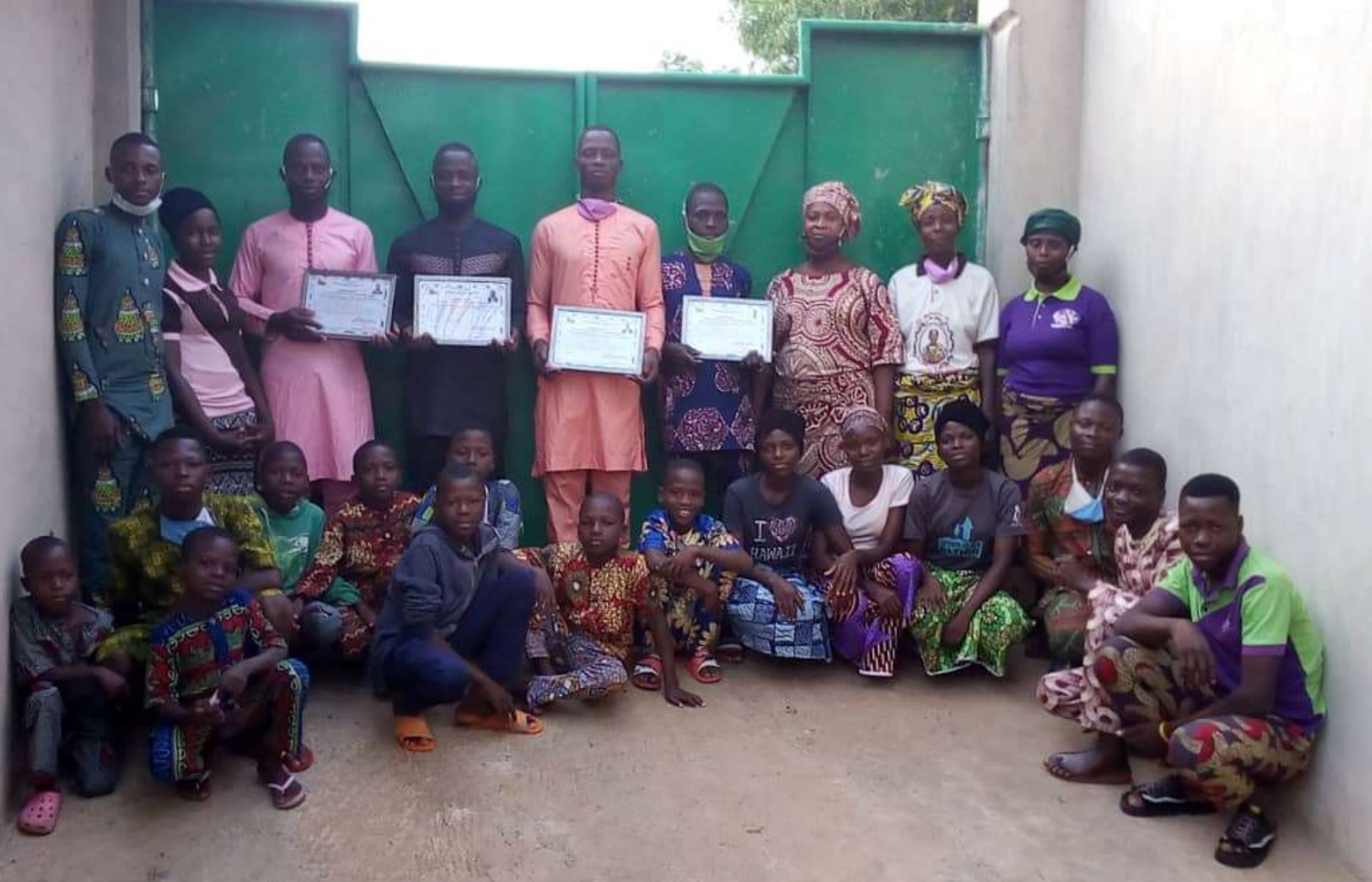
Les 4 diplômés avec des enfants et adultes de l'orphelinat