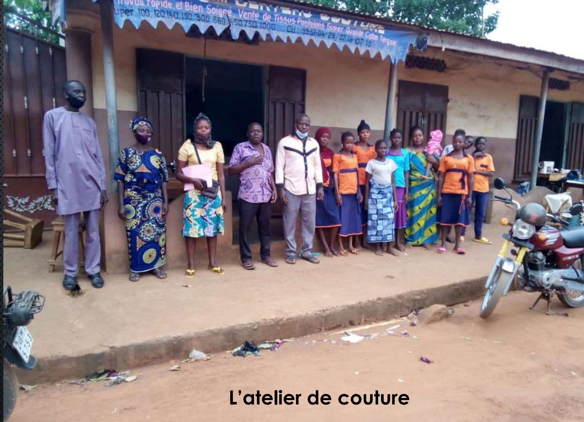
L'atelier de couture