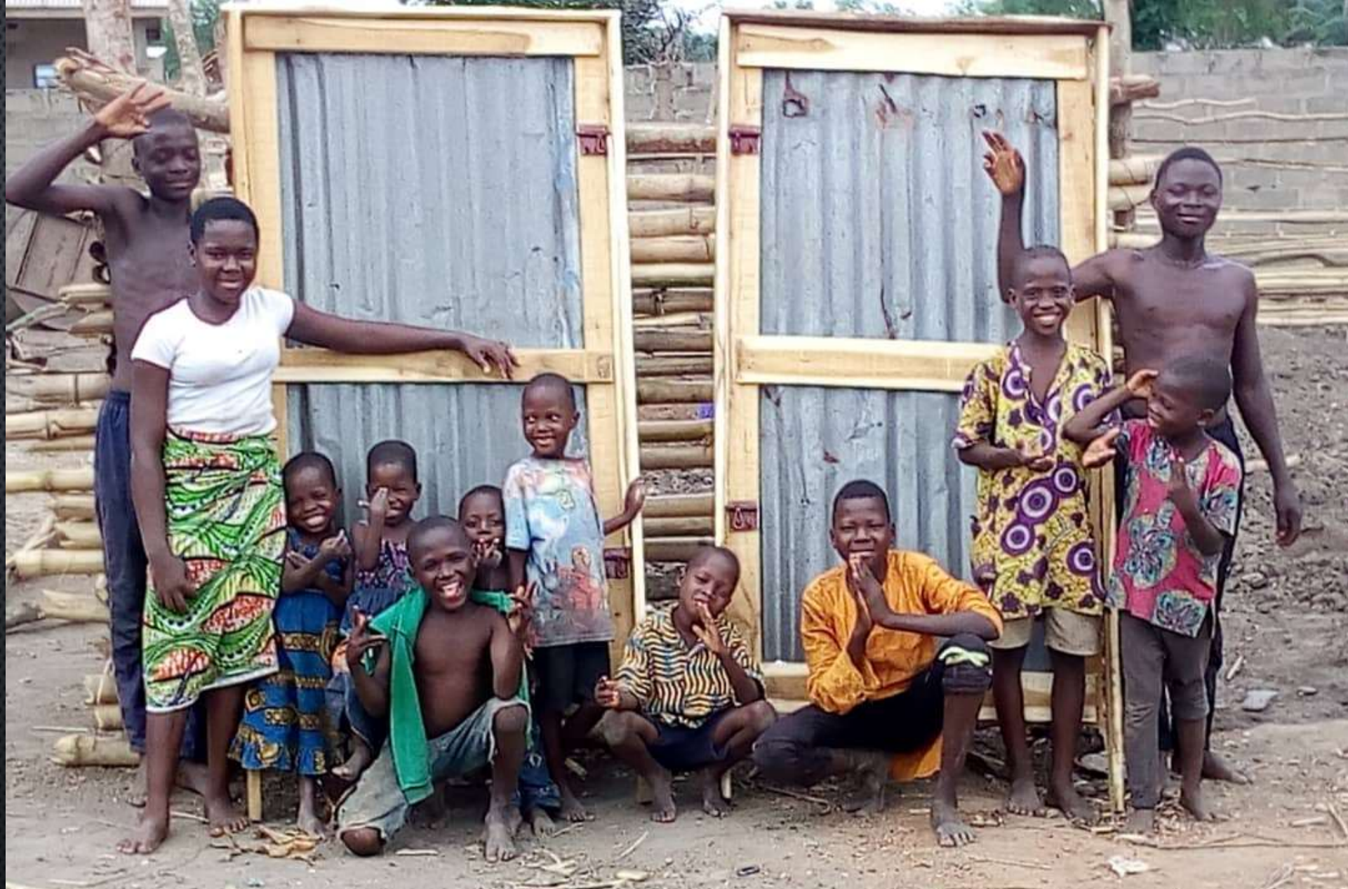
Les portes du jardin